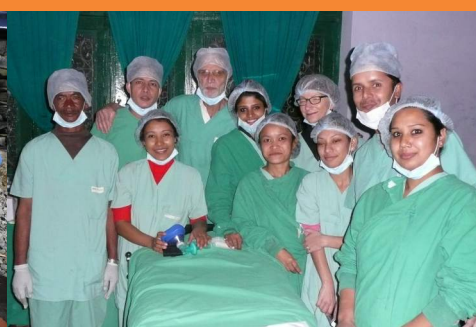
Aufwärmen zwischen Ops