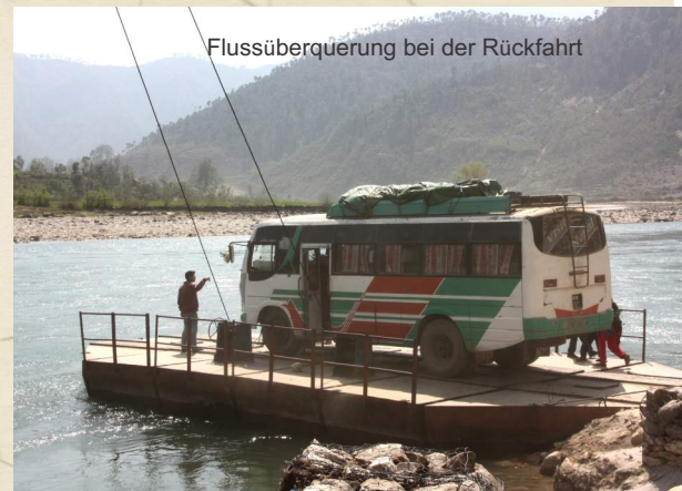
Flussüberquerung bei der Rückfahrt

ohne Pause im Op und operierten ohne Zwischenfälle und Komplikationen. Danach ging es wieder in 3 Tagesetappen zurück ins SKM-Hospital, wo alle Teammitglieder zwar erschöpft aber wohlbehalten zurück kehrten. Bei der Ankunft warteten dort schon die zurück gestellten Patienten der Vortage. In dieses entlegene Tal war noch nie ein Plastischer Chirurg oder ein Orthopäde vorgedrungen. Die Patienten kamen teilweise in 4 Tagesmärschen zur Behandlung. Eigentlich alles unverstänlich, denn die unmittelbare Nähe zum wohlhabenderen Indien lassen eigentlich bessere Behandlungsmöglichkeiten vermuten. Aber anscheinend findet dort nur minimale und teure grenzübergreifende medizinische Hilfe statt. Dieser Einsatz zeigt wiederum eindrucksvoll wie richtig wir mit unserem Behandlungskonzept in Nepal liegen und wie wichtig unsere Hilfe ist.