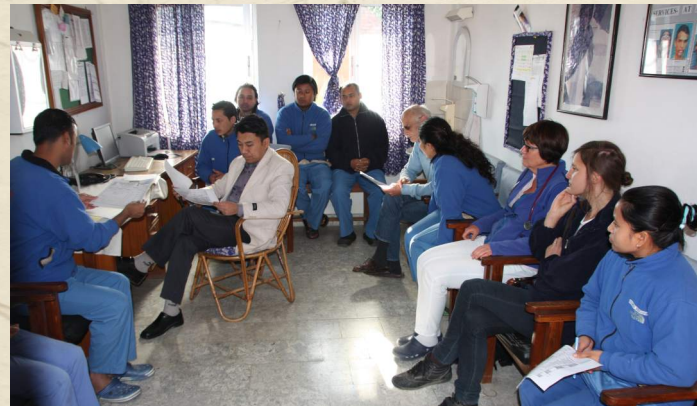
Morgenbesprechung mit Gästen

Wie jedes Jahr fanden auch diesmal wieder Operationscamps außerhalb des Hospitals statt. Dieses Campkonzept entspricht dem eigentlichen Interplastprinzip, bei dem der Arzt den Hilfsbedürftigen folgt. In diesem Fall eben nicht von Deutschland aus, sondern innerhalb Nepals. Diese Einsätze sind immer sehr effektiv, weil man sehr viele Patienten direkt vor Ort operieren kann und nur die schwereren Fälle ins Hospital bestellt und dort behandelt. So wurden im Februar in Trisuli 105 Leute untersucht und 48 operiert; im März in Accham 651 untersucht und 144 operiert und im Juni in Baglung 286 untersucht und 144 operiert!